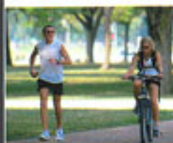
quattro passi in campagna