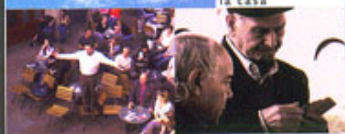
tutti insieme in piazzetta