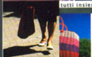
fare la spesa