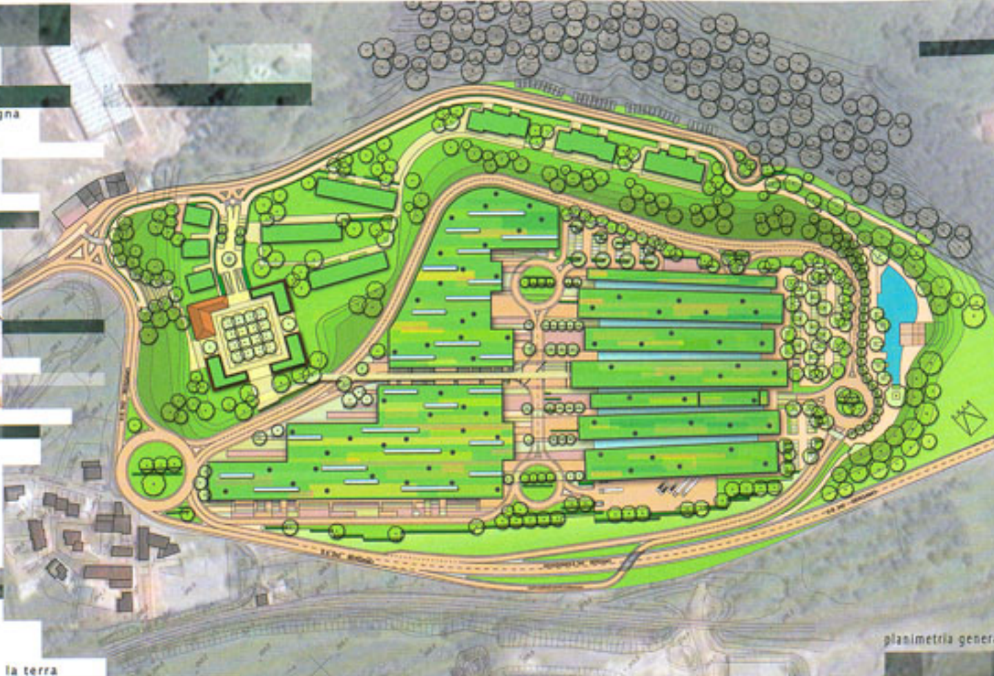
planimetria generale scala 1:1000